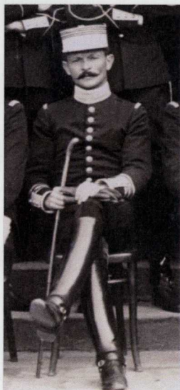
Photographie de promotion à Saumur, prise en 1912 devant le Pavillon Condé.